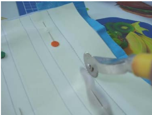
แพทเทิร์นหน้ากากอนามัยแบบ 3 จีบ

1. สร้างแพทเทิร์นหน้ากากขนาดสี่เหลี่ยมจัตุรัส กว้าง * ยาว ด้านละ 7.5 นิ้ว วัดเส้นเพื่อทำจีบจาก ด้านบนลงมา 2 นิ้ว 1 นิ้ว 0.5 นิ้ว 1 นิ้ว 0.5 นิ้ว 1 นิ้ว ตามลำดับ